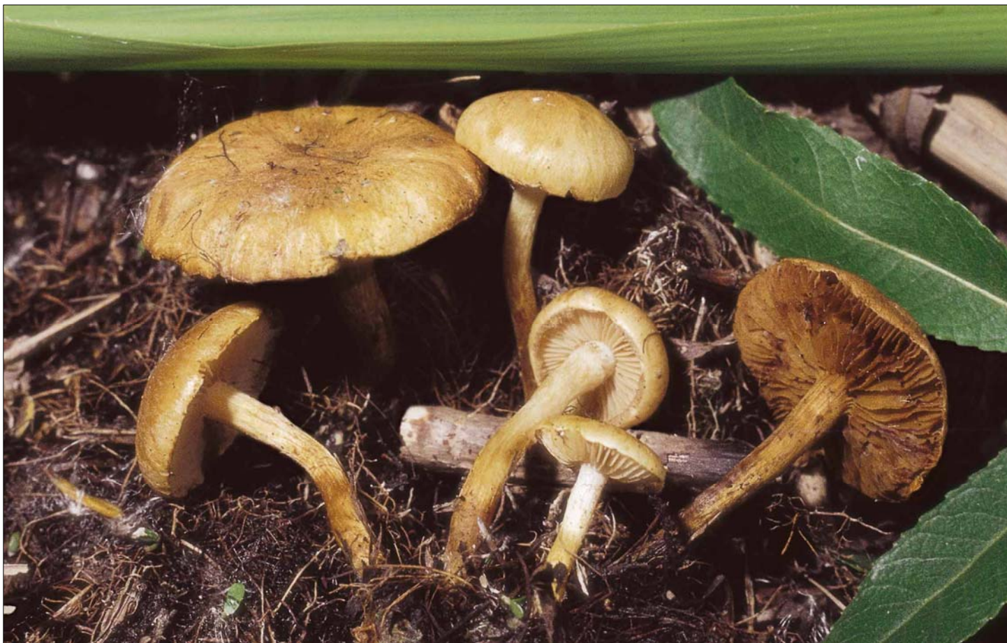
Pholiota conissans (Fr.) Kuyper et Tjall.-Beuk.